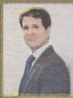
前希臘國王康斯坦丁二世的長子 Pinchos Pavlos — 46歲

本報介紹的右邊8位 Wallstreeters，雖未有獲選本港的金融人，但在當地同樣頗有人氣，不能不知。